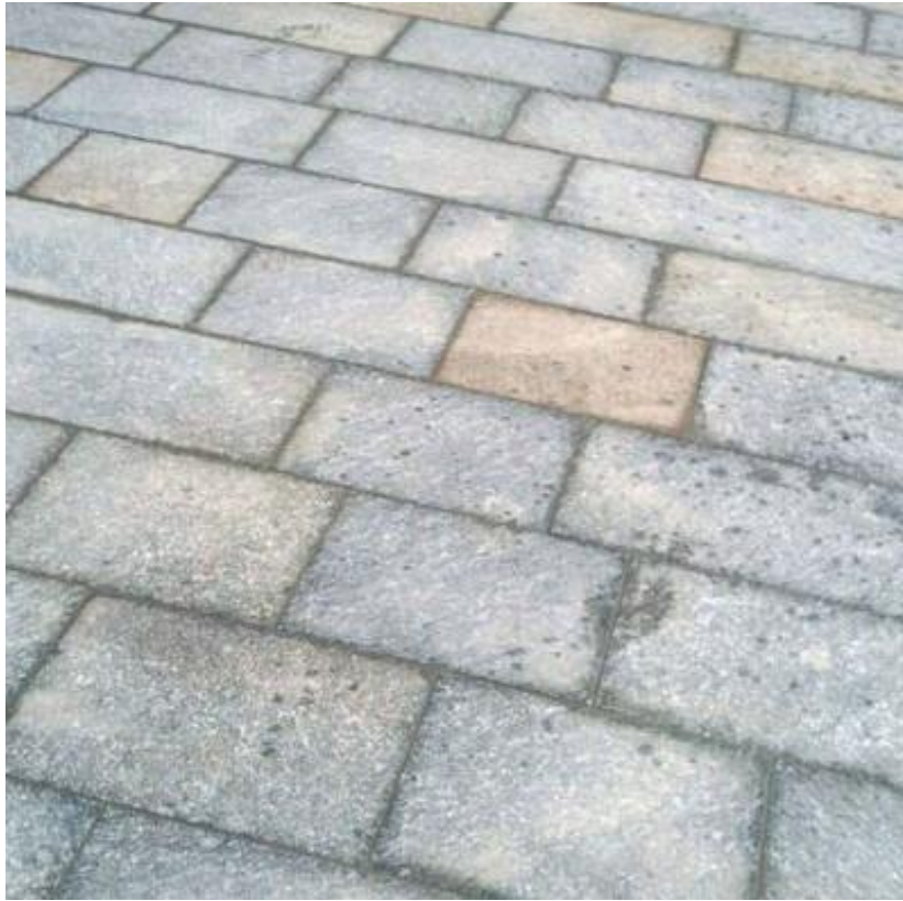
Alternative 1 Luserna Gneis – Plattenbelag in gebundener Bauweise gesägte Kanten, bruchrau gespalt