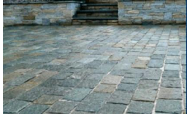
Luserna Gneis – Bindersteine in gebundener Bauweise