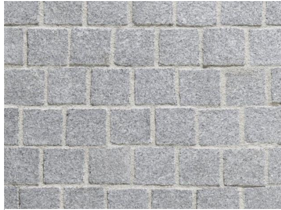
Alternative 2 – Granitpflaster grau Oberfläche gesägt und gestockt in gebundener Bauweise