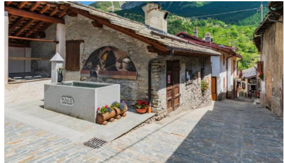
Usseaux – gebundene Bindersteine in den Dorfgassen